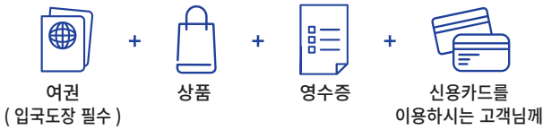
여권(입국도장 필수) + 상품 + 영수증 + 신용카드를 이용하시는 고객님께