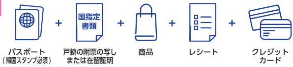
パスポート(帰国スタンプ必須) + 戸籍の附票の写しまたは在留証明 + 商品 + レシート + クレジットカード

※パスポート、レシート、カードの名義一致が必要。 ※自動化ゲートご利用の場合、帰国スタンプがない方は免税できません。