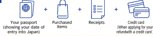
Your passport (showing your date of entry into Japan) + Purchased items + Receipts + Credit card (When applying for your refund with a credit card)

1 Please present the following at the tax-refund counter (You must make the application in person on the date of purchase):